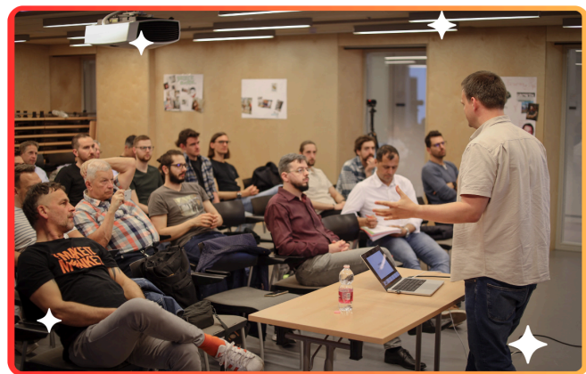
STRT Akadémia offline workshop

2023-ban a STRT online oktatási felületén 300 órányi videós tananyag volt elérhető, a több, mint 1700 regisztrált felhasználótól a társaság 1150 órányi videó megtekintést regisztrált. Az Akadémia májusi indulását követően hetente online szakmai előadásokat (összesen 21 alkalmat), havonta pedig offline