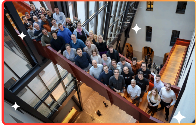
A Launchpad 2. Inkubációs programjának résztvevői

Launchpadet, összesen 9 résztvevővel. A program célja, hogy olyan csapatokat szólítson meg, akik nemzetközi piacra alkalmas, skálázható termékeket építenek. A program intenzív oktatási program mellett segíti a cégek piaci validációját, piacra lépését és kockázati tőkebevonásuk előkészítését. A programot nemzetközi, vállalkozói háttérrel rendelkező, mintegy 50 fős mentorgárda közreműködésével folytatta le a társaság. A rezidens startup alapítók felügyelete alatt folyó 12 hetes mentorálás olyan innováció a startup keltetésben, ami