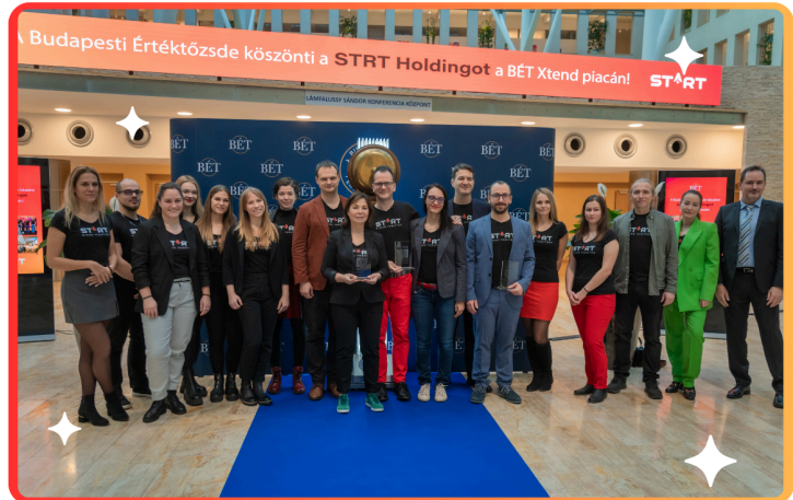
A STRT csapata

mérlegfőösszeg 695,85 Ft. A társaság a 2023 végi évfordulóval 2.946 millió Ft vagyont kezel (Befektetési portfólió 1.979 millió Ft, Tagi kölcsönök 60 millió Ft, Egyéb befektetések: 525 millió Ft, Pénzeszközök és bankbetétek 383 millió Ft). Ugyanezen időszak alatt a portfólióérték 1.429 millió Ft-ról 1.979 millió Ft-ra nőtt. A cégcsoport oktatási, mentorálási árbevétele 2022-ről 2023-ra 108%-al nőtt, 59 millióról (különálló cégek teljesítménye az összevonás előtt) 123 millió forintra.